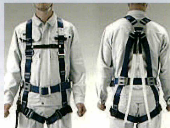
フルハーネス型墜落制止用器具