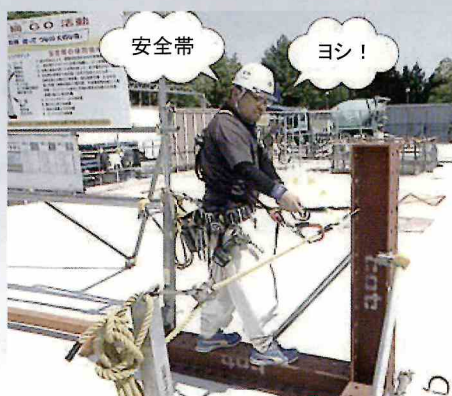
試行ゲートで点検と訓練